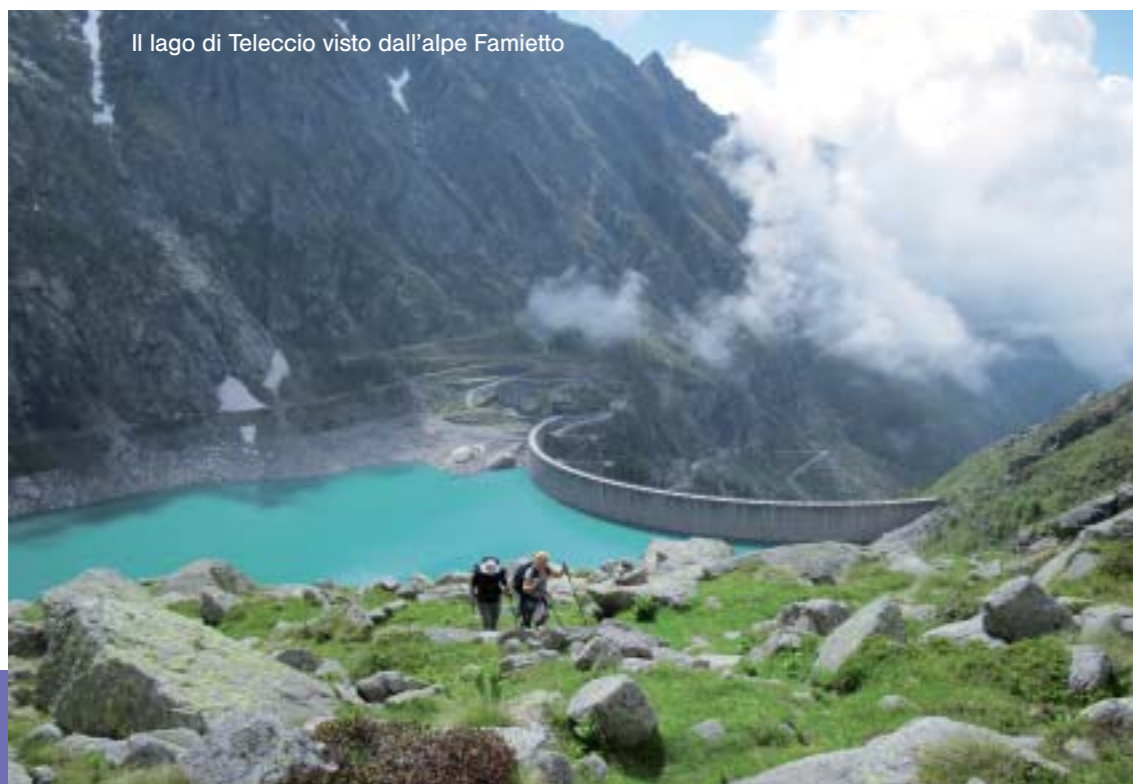
Il lago di Teleccio visto dall'alpe Famietto

Accesso stradale: dall'autostrada A 5 Torino-Aosta, uscire al casello di Ivrea. Prendere la direzione Castellamonte, Cuornè e seguirla fino nei pressi di Salassa. Prendere a destra la strada statale 460 per Pont Canavese. Volgere a sinistra per Ceresole Reale, superare Locana e, in località Rosone, volgere a destra, risalire il Vallone di Piantonetto fino al parcheggio della Diga di Teleccio.