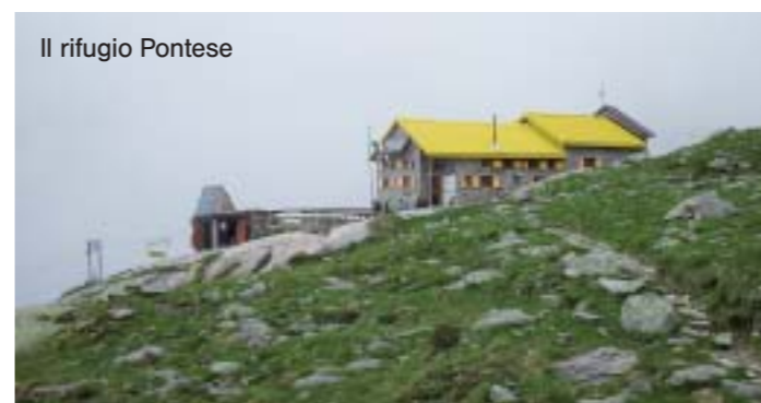
Il rifugio Pontese