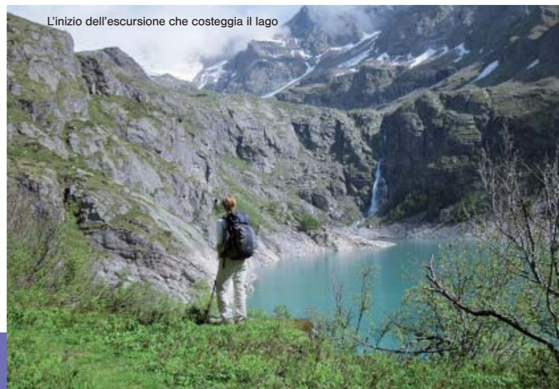
L'inizio dell'escursione che costeggia il lago

Percorso: raggiunto il parcheggio della diga di Teleccio, salire sul muro di coronamento della diga e percorrerlo verso ovest fino ad una presa d'acqua. Proseguire sulla destra orografica del lago, lungo il sentiero che sale e raggiungere l'Alpe Famietto 2152 m. Continuare a salire costeggiando per un tratto un torrentello, quindi attraversare a mezza costa in direzione nord e raggiungere l'Alpe Madonera 2265 m. Proseguire, perdendo qualche metro di quota, fino all'Alpe Giafor 2236 m, nei pressi della quale si incontra l'itinerario dell'Alta Via Canavesana. Tralasciare il sentiero che si dirige a sinistra per seguire il sentiero a destra, in discesa, attraversare il torrente, piegare a destra, e in breve raggiungere il rifugio Pontese. Per il rientro, prendere il sentiero, sulla sinistra orografica del vallone, che scende inizialmente a debole pendenza, quindi si abbassa a tornanti fino sulla riva del Lago di Teleccio. Raggiungere la stradina che costeggia il lago e seguirla fino alla diga per riportarsi al parcheggio.